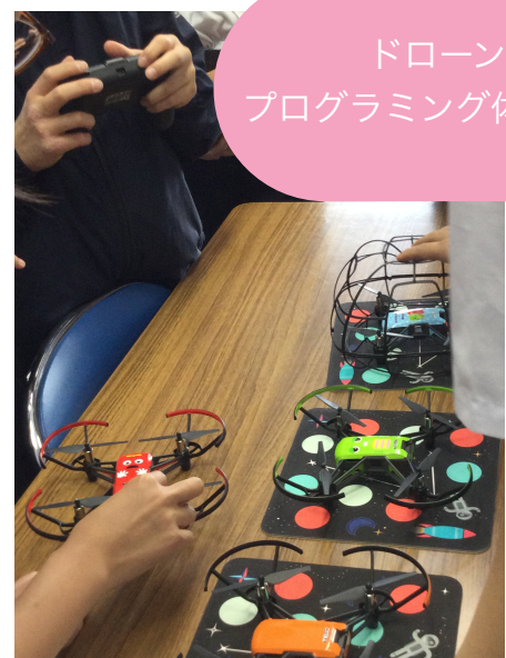
ドローン プログラミング体験講座