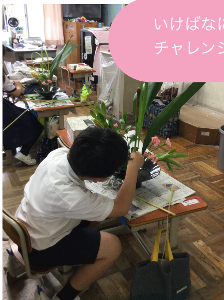
いけばなに チャレンジ