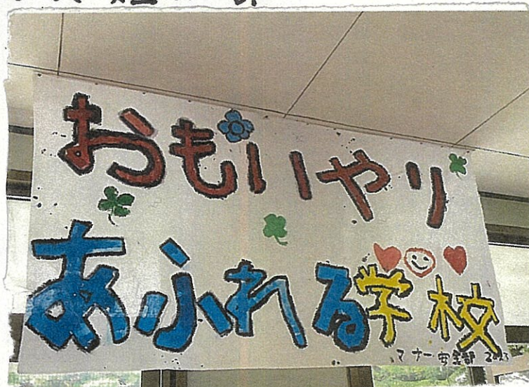
写真 安全マナー部

今月の活動はアンケートをとる・放送・ポスター・あいさつ運動の4つです。まず放送であいさつについて知ってもらい、アンケートで今のあいさつの様子を知り、それにそった活動も取り入れていきます。またポスターであいさつを呼びかけたり、あいさつ運動で学年別のかかわりを持ったりしていきたいです。そしてみんなが誰とでもあいさつを交わし笑顔になるようにしたいです。