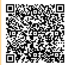
申し込み用QRコード

※本校ホームページにあります「研究発表協議会申し込みフォーム」(下記URL)またはFAXにて、本校宛にお申し込みください。 https://www.edu.shiga-u.ac.jp/fs/research/open-study-group/entry/ (FAXの場合、右上の参加申込用紙をご利用ください。)